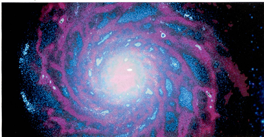
Simulierte Explosion: Im Modellbild der Milchstrasse sind die Gaswolken rot, die Sterne blau gefärbt.

Dank der richtigen Modellierung des Effekts gewaltiger Sternexplosionen, so genannter Supernovae, die Gas aus dem Zentrum der Galaxie schleudern und somit dort den Rohstoff für Sterne verknappen, konnten die Forscher auch die schlanke Struktur des Galaxienzentrums reproduzieren. Die Simulation, die zum Teil am Swiss National Supercomputing Centre bei Lugano durchgeführt wurde, nahm mehr als acht Monate in Anspruch. Leonid Leiva ■