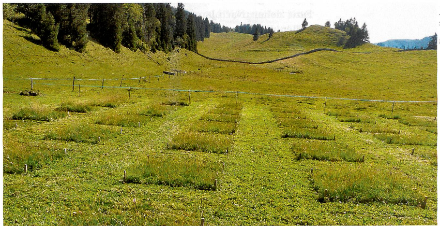
Kein Schachbrett: Versuchswiese im Jura.

wodurch die Zersetzung von Pflanzenresten, die Bodenatmung und damit die Biomassenproduktion der übrigen Arten beeinträchtigt werden. Bei Trockenheit sind die Folgen noch einschneidender. Die Forschenden zeigten zudem, dass sich die im Wurzelbereich weniger konkurrenzfähigen untergeordneten Arten zur Wasser- und Nährstoffversorgung mit Mykorrhiza-Pilzen verbinden. Vom Netzwerk unterirdischer Pilzfäden profitieren alle Pflanzen. Auch wenn die genauen Mechanismen dieser Wechselwirkungen noch nicht bekannt sind, zeigen solche Forschungsarbeiten, dass für die Widerstandskraft der Flora, besonders auch gegenüber Klimaveränderungen, jede Art zählt und zum Gleichgewicht des Ökosystems beiträgt. Mireille Pittet