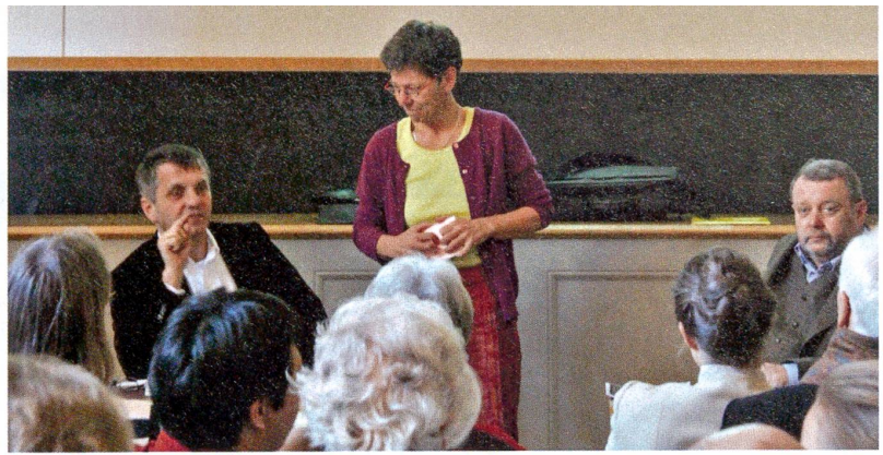
Café Scientifique Basel

Frage und Antwort stammen von der SNF-Website www.gene-abc.ch , die unterhaltsam über Genetik und Gentechnik informiert.