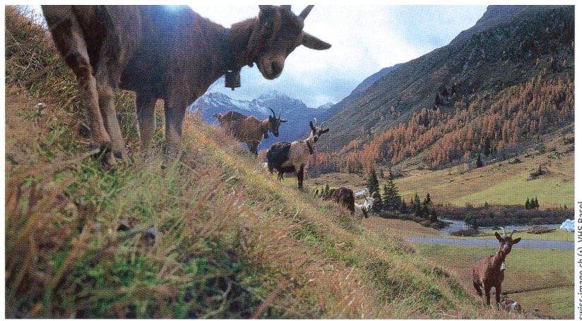
swiss-image.ch (L), VHS Basel

Quelle: Frage und Antwort stammen von der SNF-Website www.gene-abc.ch , die unterhaltsam über Genetik und Gentechnik informiert.