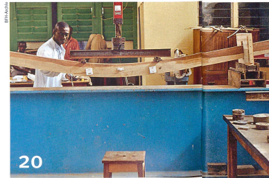
20 Hält der Träger wirklich? Was Brücken in Ghana bewirken.

Umschlagbild oben: In einem Vereinslokal von Immigranten in der Schweiz