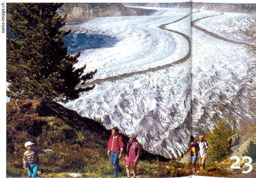
Gletscherspuren liessen Geologen vor 200 Jahren über die Entstehung der Erde rätseln.