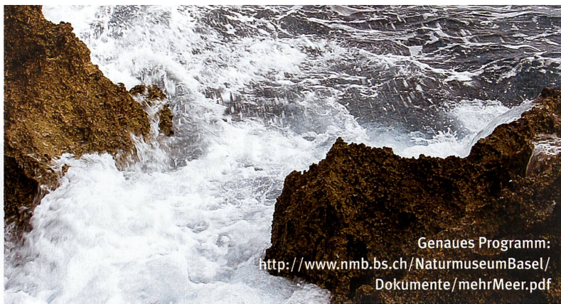
Genaueres Programm: http://www.nmb.bs.ch/NaturmuseumBasel/Dokumente/mehrMeer.pdf

Auch Ihre Frage ist herzlich willkommen: «Horizonte», Schweiz. Nationalfonds Wildhainweg 20, 3001 Bern Fax 031 308 22 65, E-Mail: pri@snf.ch