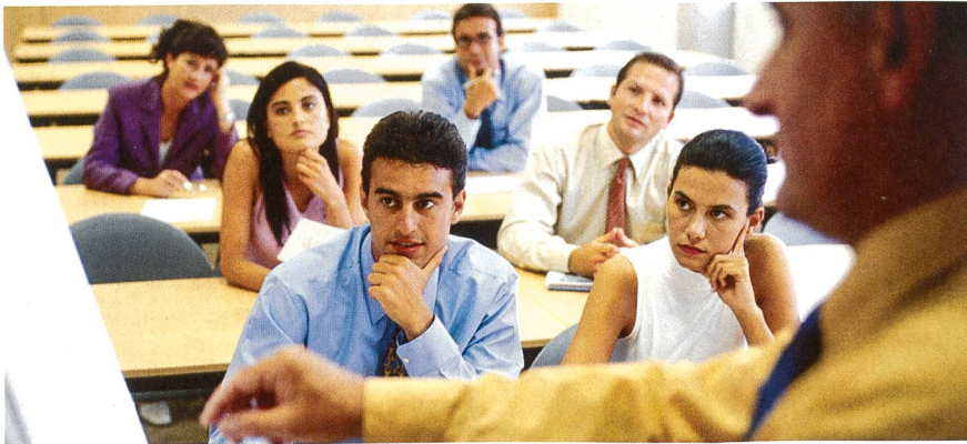
Vor allem 25- bis 50-jährige Männer in höherer Kaderposition können sich in Schweizer Firmen weiterbilden.