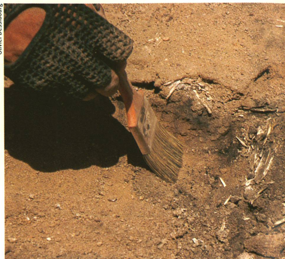
Siedlungsgeschichte und Klima sind in Chile eng verknüpft.