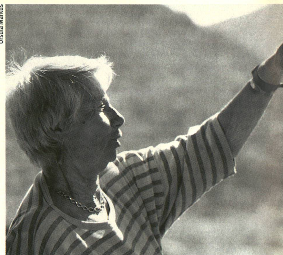
Die Pflege von verwirrten Angehörigen will gelernt sein.