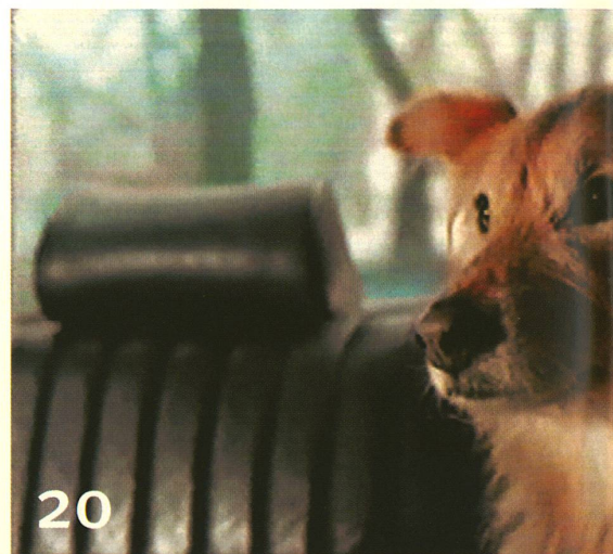
Spürnase mit übersinnlichen Kräften: Poesie in der Werbung