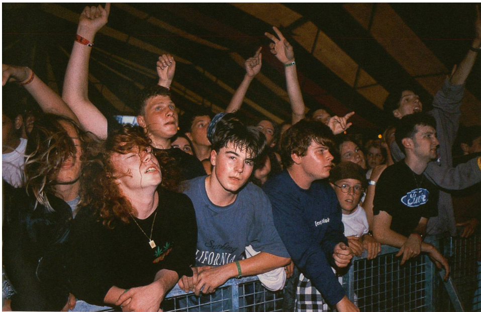
Der kulturelle Hintergrund trennt sie, die Globalisierung verbindet sie; alle suchen sie die Unabhängigkeit: japanische und Schweizer Jugendliche.

traditionsgemäss eine grosse Bedeutung hat, glauben die Menschen entsprechend weniger, des eigenen Glückes Schmied zu sein. Während es in der europäischen Gesellschaft ein erstrebenswertes Ziel ist, Einfluss zu nehmen, versucht man in der japanischen Gesellschaft, sich einzufügen.