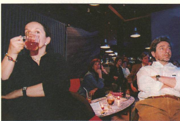
WISSENSCHAFTS-KOMMUNIKATION: In einem Genfer Café stellen sich Wissenschaftlerinnen und Wissenschaftler einem Laienpublikum. Auch dumme Fragen sind erlaubt.