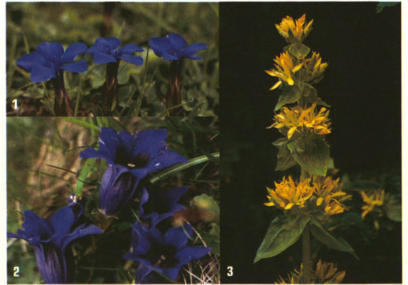
Der Frühlingsenzian (1), der Stengellose Enzian (2) und der Gelbe Enzian (3) sind eng miteinander verwandt.

«Die Untersuchungen des Erbguts, welche es erlauben, die Ahnengeschichte einer Pflanze zu eruieren, werfen ein ganz neues Licht auf die Ursprünge der Alpenflora», erläutert Philippe Küpfer. Die Forschungsarbeiten haben so ergeben, dass