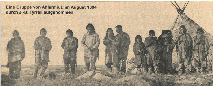
Eine Gruppe von Ahiarmiut, im August 1894 durch J.-B. Tyrrell aufgenommen

Yvon Csonka konnte auch nachweisen, dass die Ahiarmiut stets in Verbindung mit küstenbewohnenden Inuit blieben. Eine solche Strategie macht sich bezahlt, wenn ausnahmsweise – ungefähr einmal alle 100