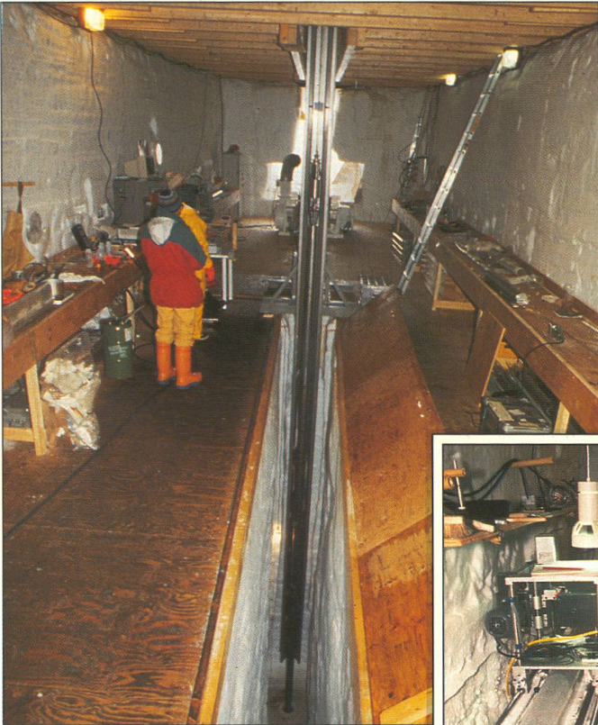
Oben: Das Nervenzentrum des GRIP-Projekts; diese Kuppel beherbergt die Bohrinstrumente.