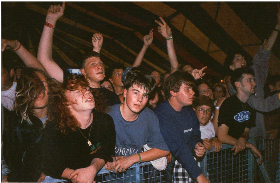
L'arrière-plan culturel les sépare, la globalisation les rassemble: Suisses ou Japonais, les jeunes luttent pour leur indépendance.

destin. En revanche, l'Extrême-Orient accorde traditionnellement une grande place à la collectivité: partant, les individus s'estiment moins responsables de leur propre fortune. Alors que dans la société occidentale, prendre son envol est un objectif en soi, au contraire, au Japon, on cherche plutôt à se couler dans le moule.