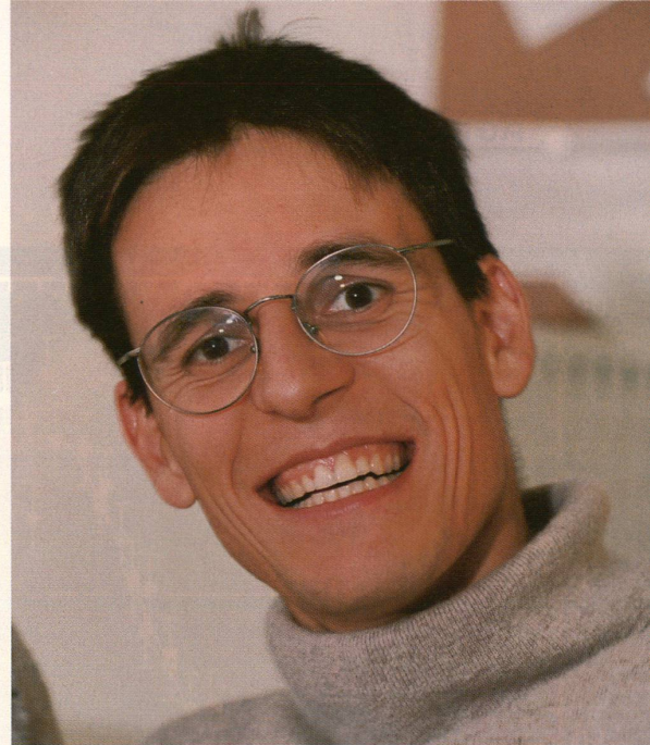
Il espère, encore de son vivant, trouver des planètes semblables à la Terre: Didier «Alien» Queloz.

mais je suis ici avec ma famille, tandis qu'en Suisse, il n'existe même pas de statut de visiteur pour les chercheurs étrangers qui veulent venir y travailler.» En fait, la véritable identité de Didier Queloz est «Distinguished Visiting Scientist»: «Nous ne sommes que quatre à l'avoir sur le site», qui compte 4900 employés.