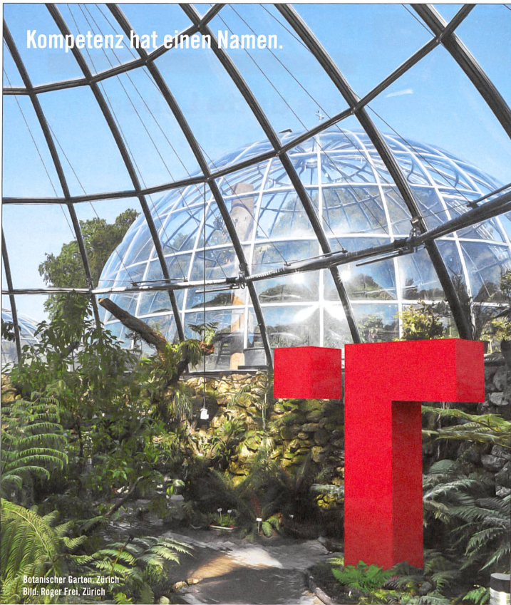
Botanischer Garten, Zürich