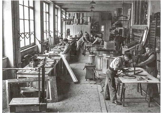
An ihrem neuen Arbeitsort in Zürich-Brunau falzen und kanten die Handwerker in hellen, grosszügigen Werkhallen.

Werben mit dem Clubhaus des Zürcher Yacht Clubs, für das Scherrer das Metalldach fertigte.