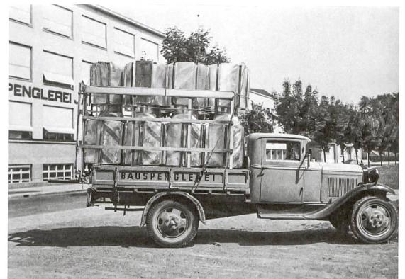
Der erste Firmenlaster liefert Lüftungshüte für grosse Hallen, sogenannte Aspirateure, aus.

nicht eben rosig. Mitarbeiter wurden an andere Firmen ausgeliehen – sie waren wegen ihrer breiten Ausbildung begehrt. Die Spenglerei überstand die Krisenjahre trotz viel zu grossem neuem Firmensitz ohne Kurzarbeit und Kündigungen. Die «Landi» 1939 entspannte die Situation kurzfristig. Scherrer war unter anderem für das Dach des neuen Kongresshauses verantwortlich.