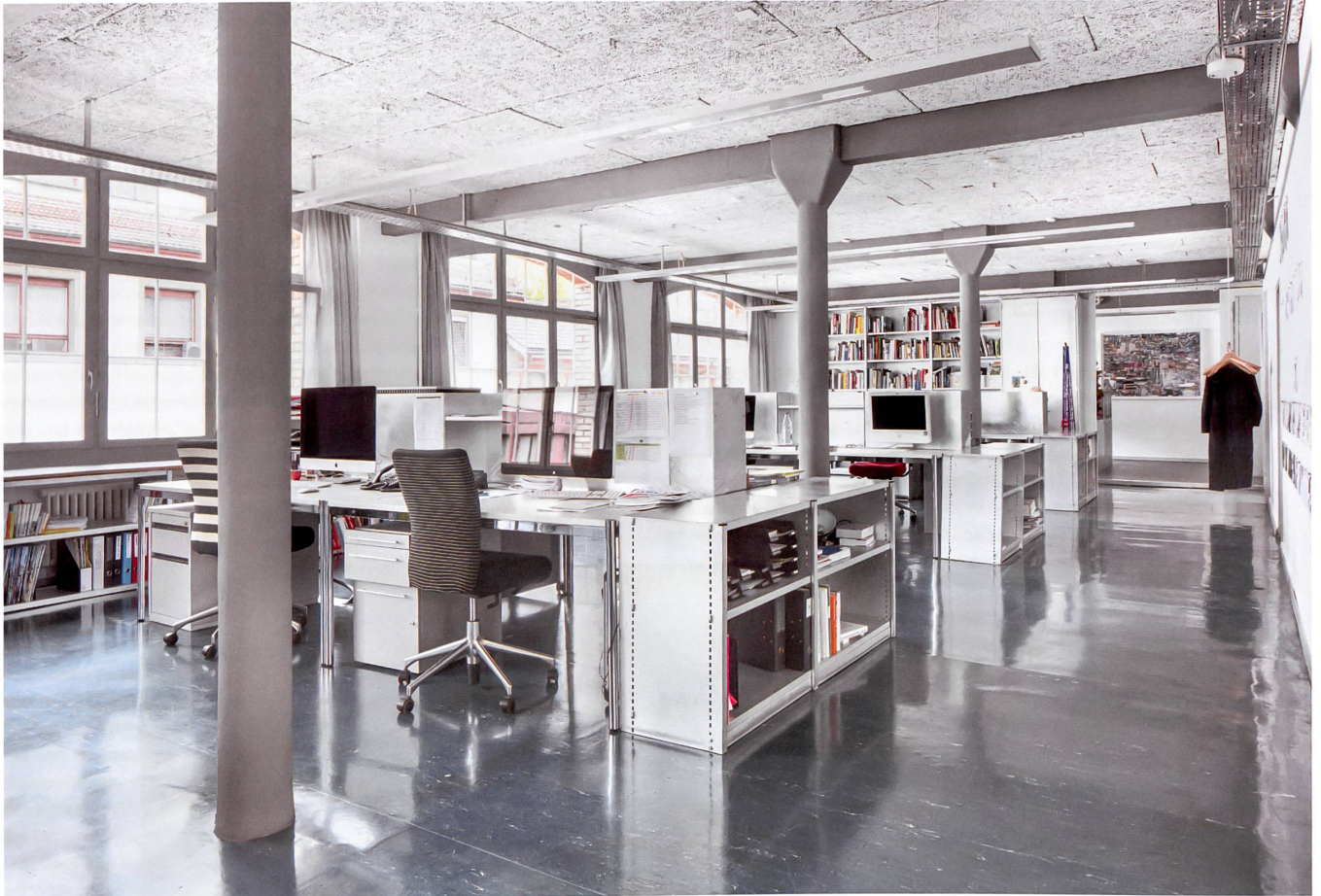
«Ausräumen» war die Devise bei Hochparterres Umbau an der Ausstellungsstrasse in Zürich. Zum bestehenden Mobiliar haben die Architekten einzig neue Tischmöbel entwickelt.