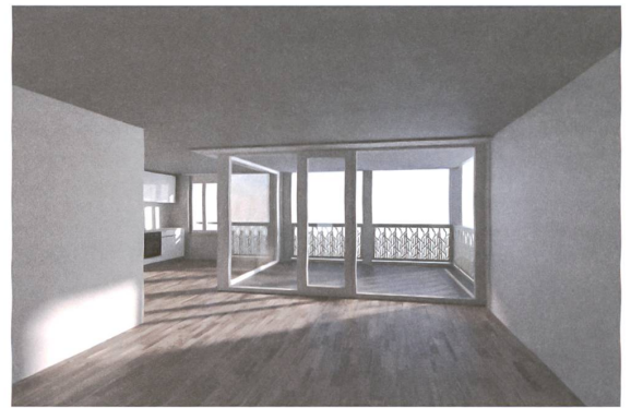
In den grossen Wohnungen sind Küche und Wohnzimmer nach Süden und zum Balkon gerichtet.