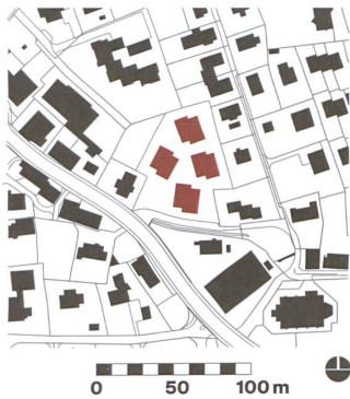
Die vier Häuser entstehen im Dorfkern nahe der Kirche, unten rechts.