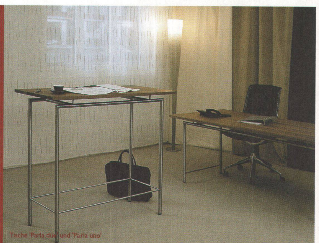
Tische 'Parla duo' und 'Parla uno'

Victoria Design AG Mühlegasse 18 CH 6340 Baar ZG T. +41 41 769 53 53 F. +41 41 769 53 54 info@victoriadesign.ch www.victoriadesign.ch