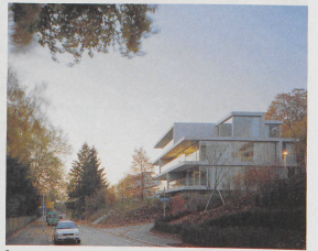
1 Die leicht glänzenden Betonscheiben transportieren das Grün der Umgebung in die Tiefe der Räume.

Gespräche führen statt Pläne zeichnen Beinahe hat man den Eindruck, der Architekt habe seine ganze Energie auf das Haus konzentriert und den Garten in Architektenarroganz als Quantité négligeable vernachlässigt. Doch der Eindruck täuscht, das Gegenteil ist richtig. Auch am Garten hat der Architekt intensiv gearbeitet, damit er am Ende zu seinem Hause passt. Von Anfang an →