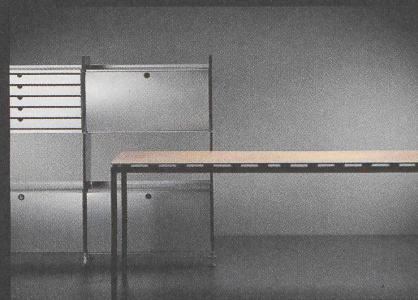
BERATUNG UND VERKAUF