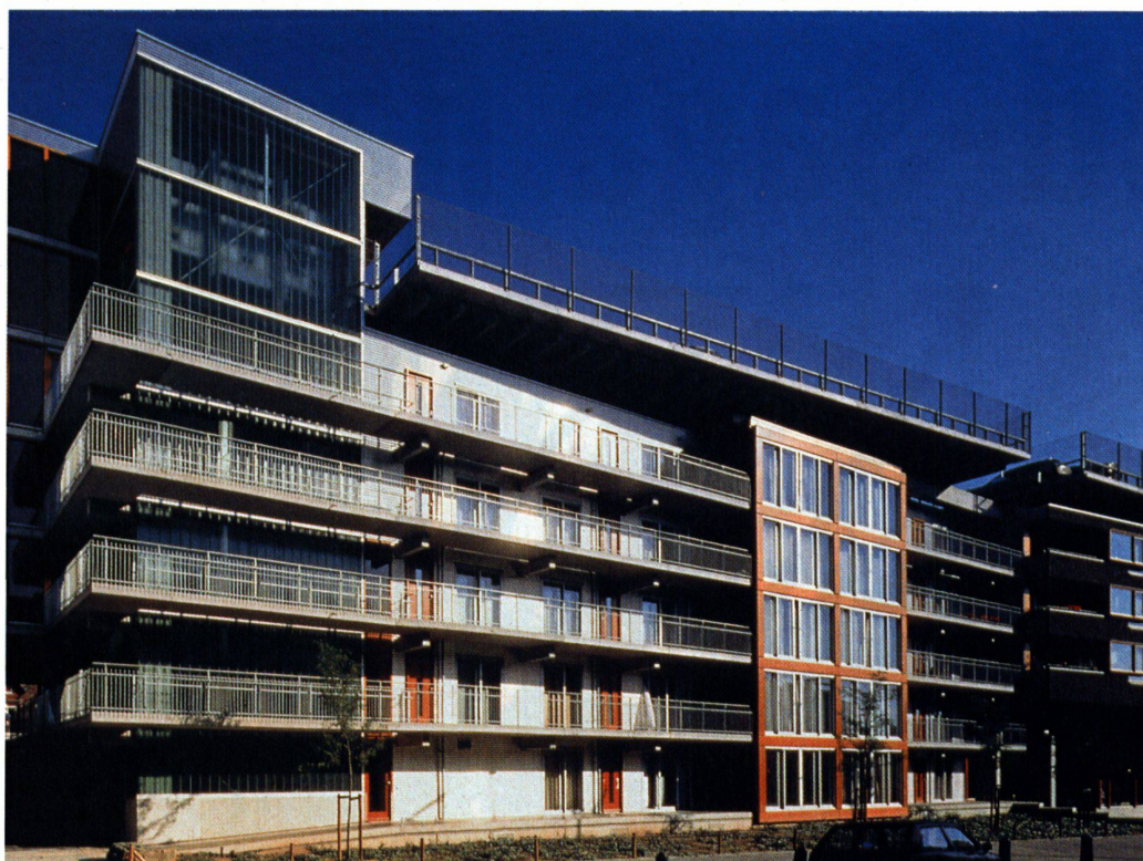
Architekten: Mastenbroek & van Gameren, Amsterdam Bauherrschaft: Woningvereniging Kolping Planungs- und Bauzeit: 1992–96 Ort: Nijmegen