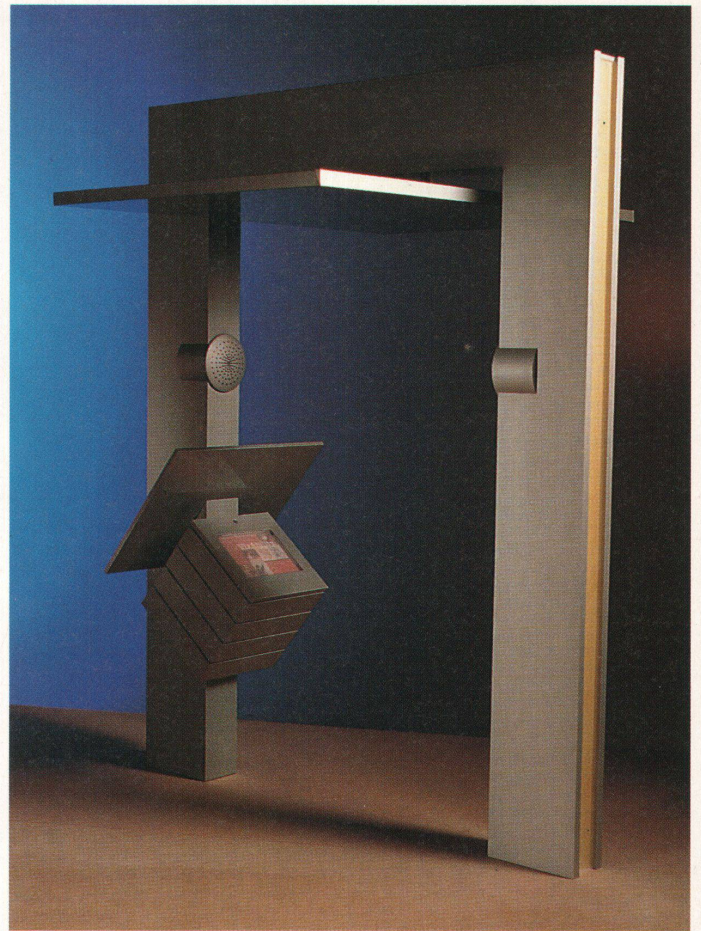
Die grosse Version des «Bürgerterminals», ein Stadttor mit einem Dach für Solarpaneele