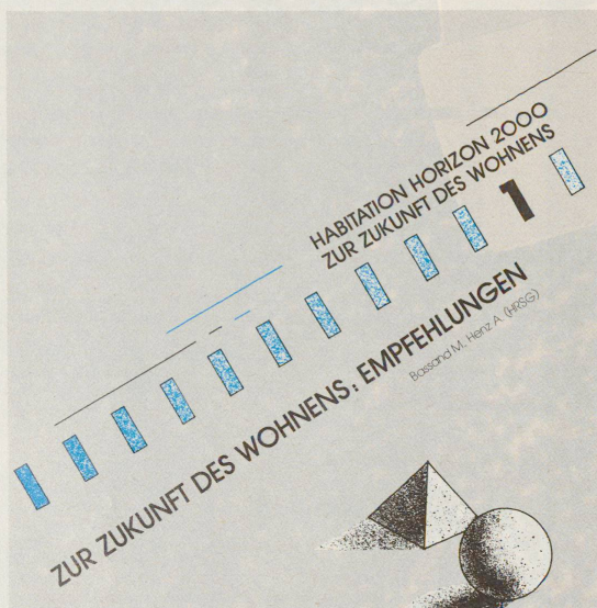
ETH-Forschungsbericht: Schlussfolgerungen von dünner Konsistenz.

«Zur Zukunft des Wohnens: Empfehlungen»: Ein Forschungsbericht mit diesem Titel aus der Küche der beiden ETHs weckt Erwartungen. Erwartungen, die allerdings kaum erfüllt werden. Wesentliches wie etwa der Bezug zur ökonomischen Realität wird kaum gestreift.