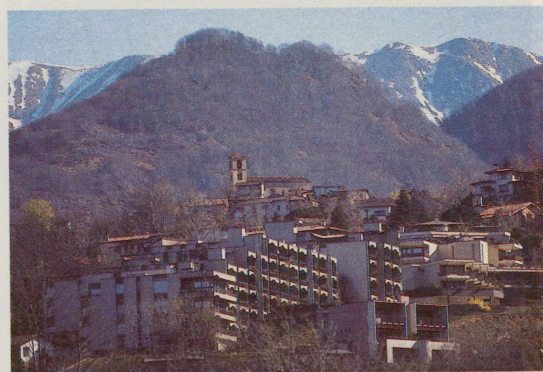
Zweitwohnungsresidenz Cadrolina: widersprüchliche Planungspolitik.

Die deutschsprachige «Tessiner Zeitung» zeigte kürzlich auf, wohin die unaufhörliche «touristische Entwicklungshilfe» im Tessin führt: In Orselina und Brione oberhalb Minusio beträgt der Zweitwohnungsanteil 60 Prozent.