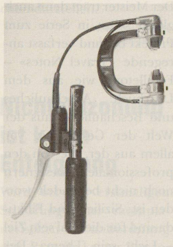
Wie in Hannover wurde das Systemtelefon von Ascom auch in Essen prämiert. Es steht in einer Warenwelt von luxuriösen Fahrradbremsen bis zu formal reduzierten Waschmaschinen.

von deutschem Design. In der Spitzengruppe sind gleichwohl Engländer, Japaner und Amerikaner. Aus der Schweiz wurden folgende Produkte ausgezeichnet: