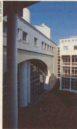
Das Gymnase de Nyon (Bild) und die Baufachschule in Tolochenaz, zwei neue Schulbauten im Welschland. Seite 62