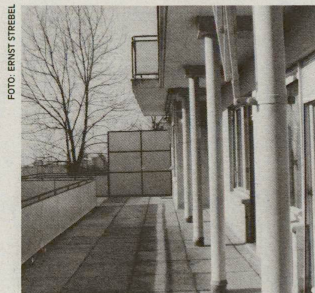
Soll unter Denkmalschutz gestellt werden: die Villa Fleiner in Zürich.

Das vor der Villa liegende Areal hingegen darf überbaut werden: mit einem zweigeschossigen Haus mit Dachterrasse. Die denkmalgeschützte Villa Fleiner sieht man dann nur vom Einfahrtstor aus. IP