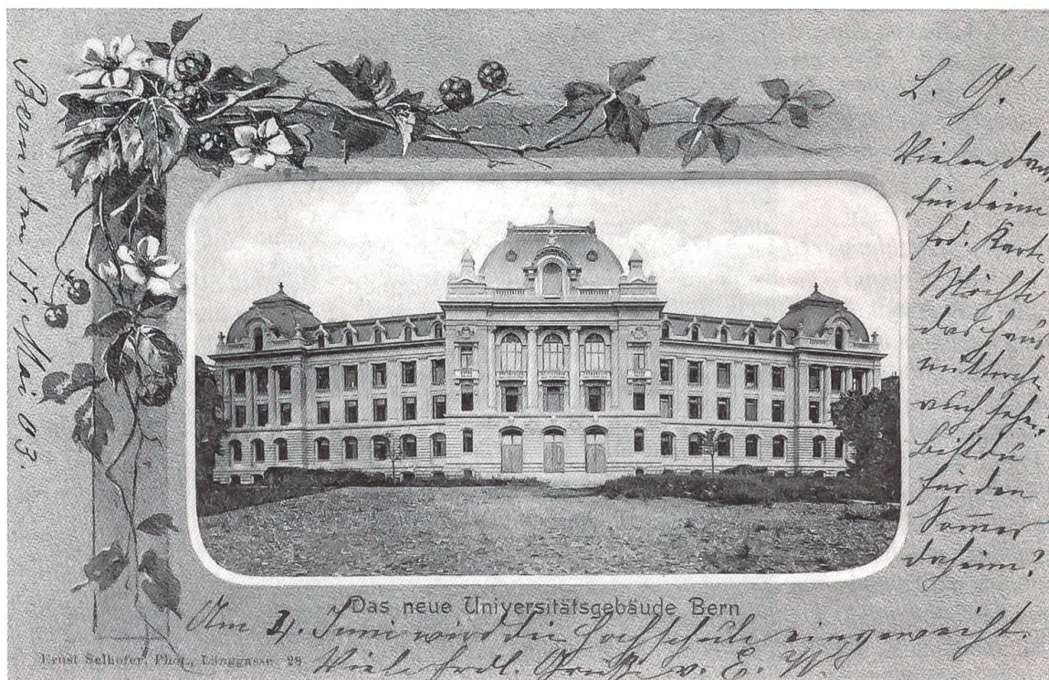
Das Universitätsgebäude auf der Grosse Schanze in Bern, kurz nach Fertigstellung im Jahre 1903

Eröffnung der Greyerzer-Bahn Eröffnung der Drahtseilbahn Saint-Imier–Mont-Soleil