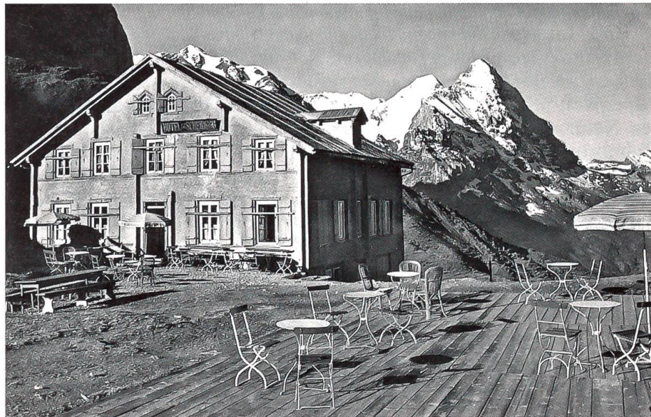
Hotel Grosse Scheidegg um 1940

Nach Grindelwald, dem Endpunkt der Berner Oberlandbahn und Anfangspunkt der Wengeneralbahn, strömten jährlich Tausende von Reisenden, der grösste Teil davon in der Absicht, den weiter im Tal zurückliegenden Oberen Gletscher zu besuchen. Da der bereits konzessionierte Aufzug zur Glecksteinhütte und zum Wetterhorn einen weiteren grossen Anziehungspunkt bilden würde, lag die Idee einer Bahnverbindung nahe. Die Herren Boss, Häslar, Reist, Studer und Weber reichten ein Gesuch für eine elektrische Schmalspurbahn ab dem Bahnhof Grindelwald zur Station Oberer Gletscher mit einer Abzweigung von Gadenstatt nach Ofni ein. Der Berührungs-