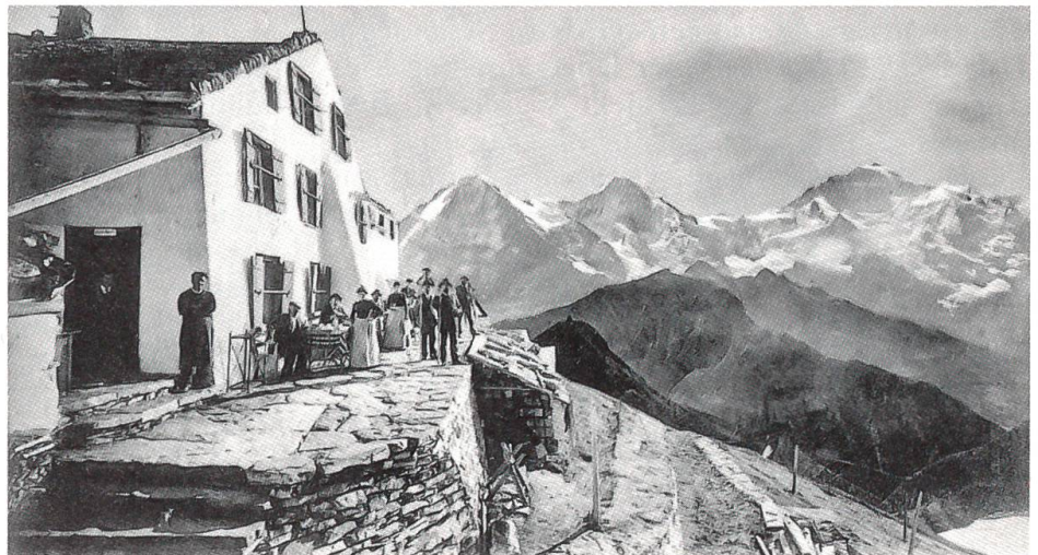
Hotel Faulhorn um 1905, 2680 Meter über Meer

Bahnpioniere und Geschäftsleute bemerkten gegen Ende des 19. Jahrhunderts auf der Eisenbahnkarte im Berner Oberland eine Verbindungslücke zwischen Meiringen und Grindelwald. Bereits 1890, im Jahr der Eröffnung der Bahnstrecke nach Grindelwald, ging das erste Konzessionsgesuch für eine Zahnradbahnverbindung zwischen den beiden Fremdenorten an den Bundesrat. Da sich in den Gemeinden Widerstand gegen das Projekt bildete, wurden