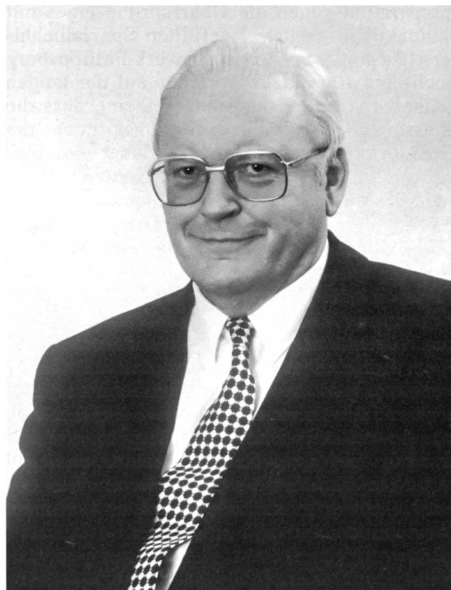
Neuer deutscher Bundespräsident: Roman Herzog Als Nachfolger des zurückgetretenen Richard von Weizsäcker wird der Präsident des Bundesverfassungsgerichts, Roman Herzog, zum neuen deutschen Bundespräsidenten gewählt.

In Deutschland ist am 23. Mai Roman Herzog, bisher Präsident des Bundesverfassungsgerichts, als Nachfolger von Richard von Weizsäcker zum neuen Bundespräsidenten gewählt worden. Ende Mai ist der letzte Staats- und Parteichef der DDR, Erich Honecker, im Exil in Chile verstorben. In den Wahlen zum Bundestag, die am 16. Oktober stattfanden, resultierte ein knapper Sieg der CDU/CSU mit ihrem Koalitionspartner FDP, was Bundeskanzler Kohl eine fünfte Amtszeit ermöglicht. Der Regierungsmehrheit mit 341 Sitzen stehen jetzt 331 Sitze der SPD und anderer Oppositionsgruppen gegenüber. Die FDP hat ihren Krebsgang fortgesetzt; sie ist jetzt nur noch in fünf der 16 Bundesländer im Landtag vertreten, weil sie zusehends mehr Mühe hat, über die Fünfprozenthürde zu kommen. Immerhin war die FDP in Hessen mit nunmehr 9% der