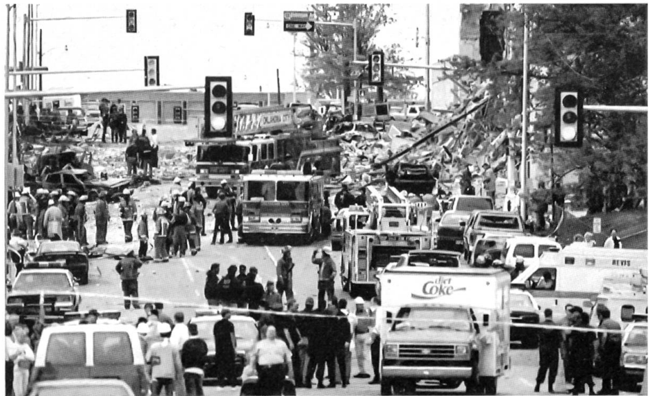
Bombenanschlag in Oklahoma City

truppen in Somalia absieht, eine recht gute Figur gemacht. Die USA steuern keineswegs einer neuen Ära des Isolationismus zu, versuchen aber ihr Engagement als Supermacht und selbstberufener Ordnungshüter in der Welt zu reduzieren und auf für die amerikanischen Interessen entscheidende Brennpunkte zu konzentrieren. Zu den von der amerikanischen Aussenpolitik noch bevorzugten Gebieten gehören jetzt der Nahe und Mittlere Osten, die Pazifikregion und die Länder des eigenen Kontinents, namentlich die Karibik und Mexiko. Aufrechterhalten wird eine weiterhin gute Beziehung zu Russland unter dem dort innenpolitisch bedrängten Jelzin. Auf der anderen Seite ist auffallend, wie unter Clinton gegen unfaire Handelspartner oder als international subversiv betrachtete Regierungen jetzt des öfteren mit den rabiaten Druckmitteln von Embargos und Handelskriegdrohungen agiert wird. Es sind nicht nur weiterhin Irak und Libyen und wiederum auch Iran, sondern neuerdings auch China und Japan so behandelt worden. Eher sonderbar mutet demgegenüber an, dass zwar Kuba immer noch boykottiert