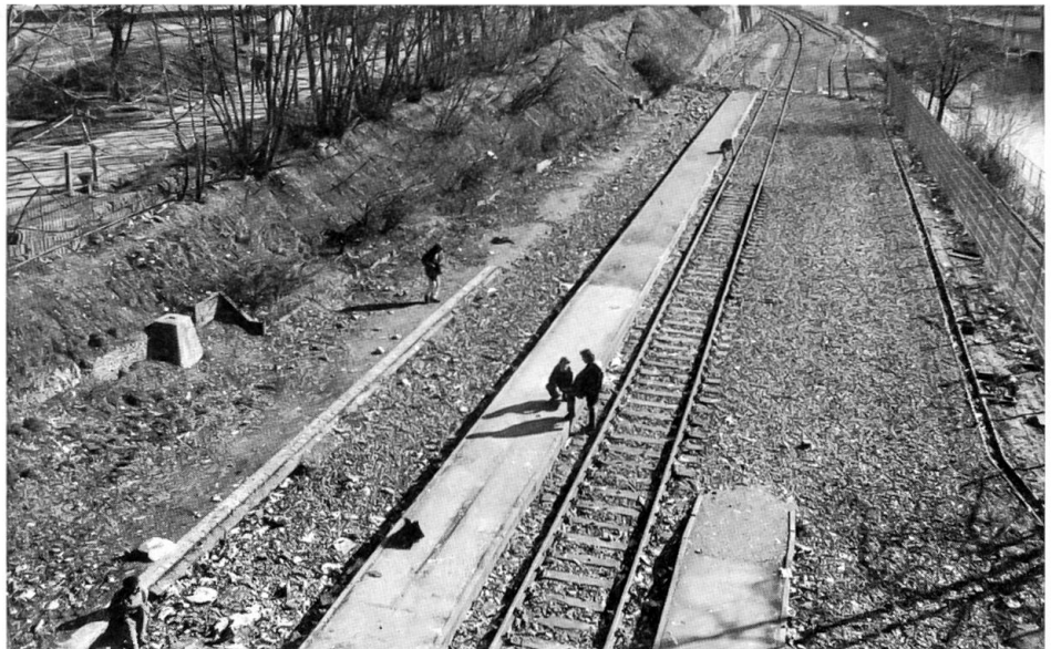
Räumung der Drogenszene am Letten in Zürich

Am 12. Juni gelangte die Initiative «Für einen patientenfreundlichen Medikamentenbezug» zur Abstimmung. Diese wollte verhindern, dass die Ärzte in bevölkerungsdichten Gebieten weiterhin Heilmittel in Selbstdispensation abgeben dürfen. Die sich in ihrer Existenz gefährdet fühlenden Apotheker haben sich in der Abstimmung gegen den Interessenstandpunkt der Ärzte erfolgreich durchgesetzt. Für den Bau einer S-Bahn-Station Ausserholligen SBB und Verbesserungen der Gleisanlagen wurde ein Verpflichtungskredit von 19 Mio. gutgeheissen, ebenso eine Sanierung und Erweiterung der Schweiz. Ingenieur- und Technikerschule für Holzwirtschaft in Biel. Am 24. September stimmte der Souverän auch einem Beitrag von 10,45 Mio. an das Sozialtherapeutische Zentrum in Kirchlindach zu, während beim gleichen Urnengang die Volksinitiative und der Gegenvorschlag des