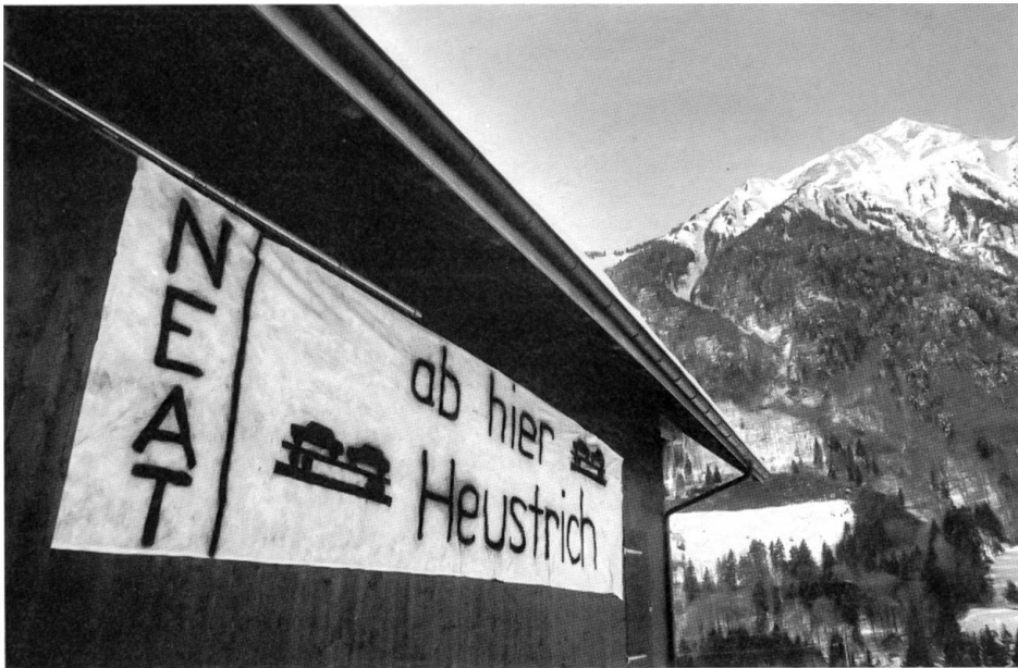
NEAT am Lötschberg

Die Aktion «Pro Frutigtal» und die betroffene Bevölkerung wehren sich für den Niesenflankentunnel mit Autoverlad ab Heustrich.