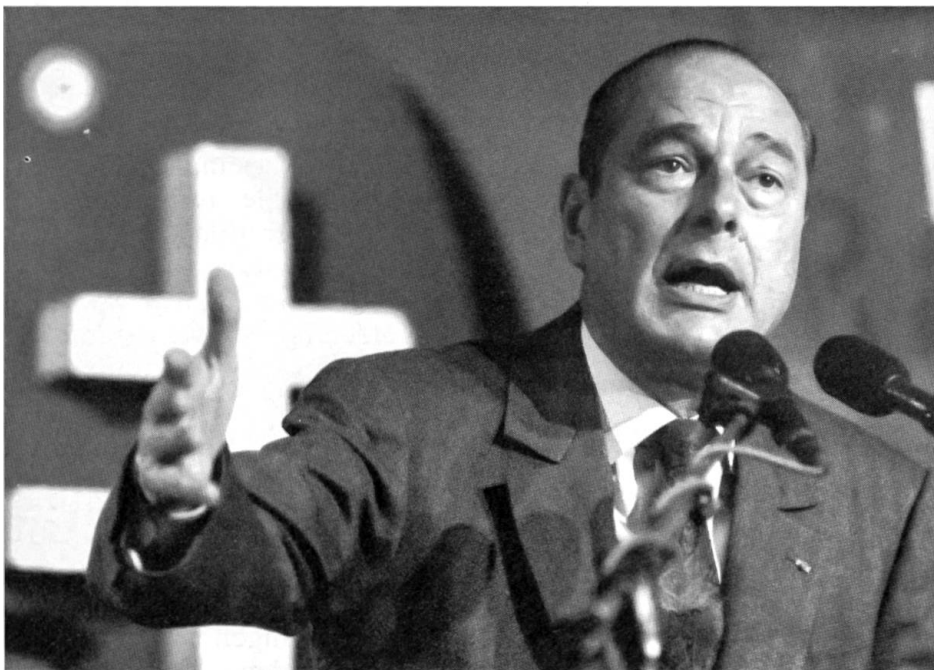
Neuer französischer Staatspräsident: Jacques Chirac

Ein neuer Teilungsplan ist am 20. Juli von den bosnischen Serben abgelehnt worden, weil diese nicht bereit waren, die ihnen zugemutete Rückgabe eines grösseren Teils des von ihnen besetzten Gebiets zu akzeptieren.