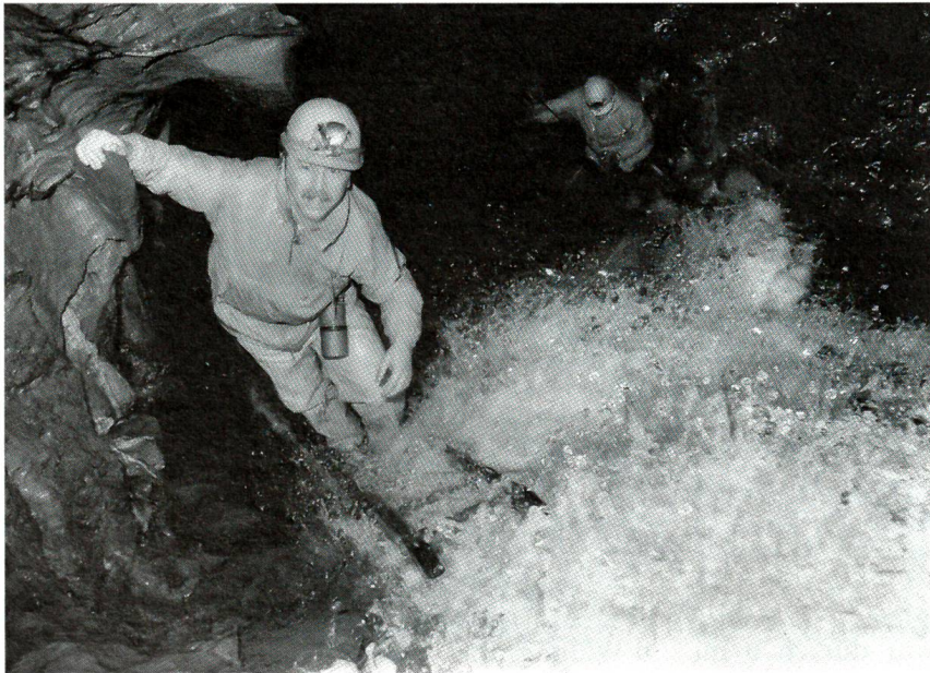
Beatushöhlen am Thunersee

Aber ds Fride mache isch nid liecht, bsungersich we der anger all Tag mit em glych toube Chopf a eim verby louft. Mängisch het er es guets Wort z'vorderischt uf