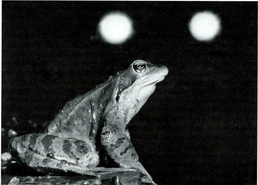
Achtung: Frösche auf den Strassen Gelungene Aufnahme eines Frosches. Ob er die gefährliche Überquerung der Strasse überleben wird?

Mi het am Tanne-Hoger gheuet. Z'Mittag het es der Hans tüecht, es wär dürsch u mi chönnt afah lade. Aber der Grössätti isch angerer Meinig gsi. Zersch müess mes no chehre oder schüttle, däwäg hälf är's nid ycherume. Der Hans het probiert etgägez'ha, es