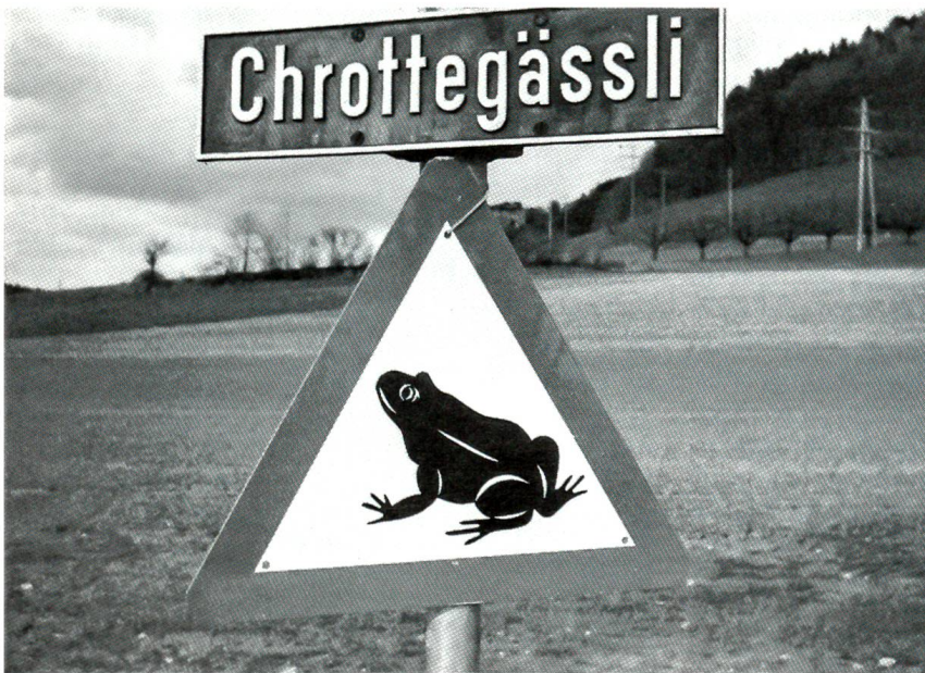
Achtung: Frösche auf den Strassen

Das wär sicher no Jahr u Tag e so ggange, we nid ei Winter e wüeschti Lungenetzündtig der Vatter hätt i ds