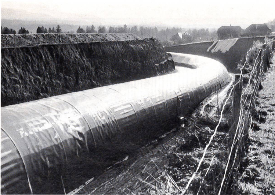
Imposanter Strassenbau in Jaberg BE

Da war also Mr. Harper, der Globetrotter, an Ort und Stelle. Aber es reute ihn fast. Der schwarze Antonio war wirklich schwarz. Ausen und innen, denn seine Augen waren stechend und lauernd. Als der Gast den Wein zur Hälfte geleert hatte, war