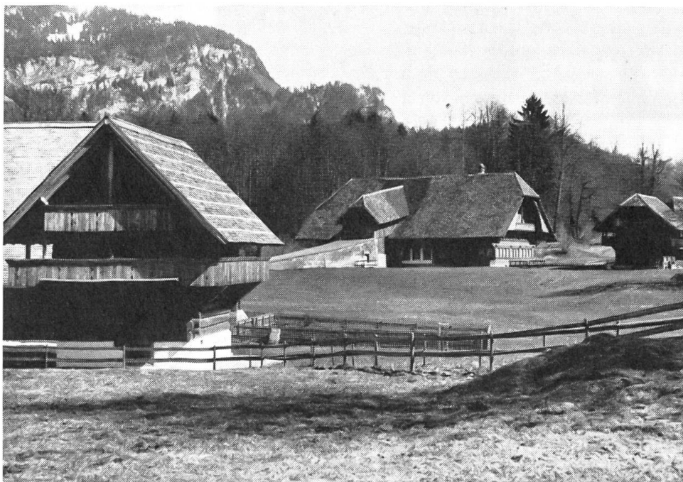
Freilichtmuseum Ballenberg/Brienz eröffnet

Endlich schwingen die breiten Flügeltüren hinter dem Geheilten zu. Die Schwester reicht