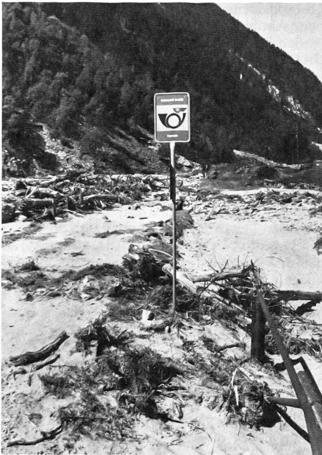
Schwere Sommer-Unwetter im Tessin

Ganze Strassenstücke wurden von den entfesselten Fluten im August 1978 weggeschwemmt.