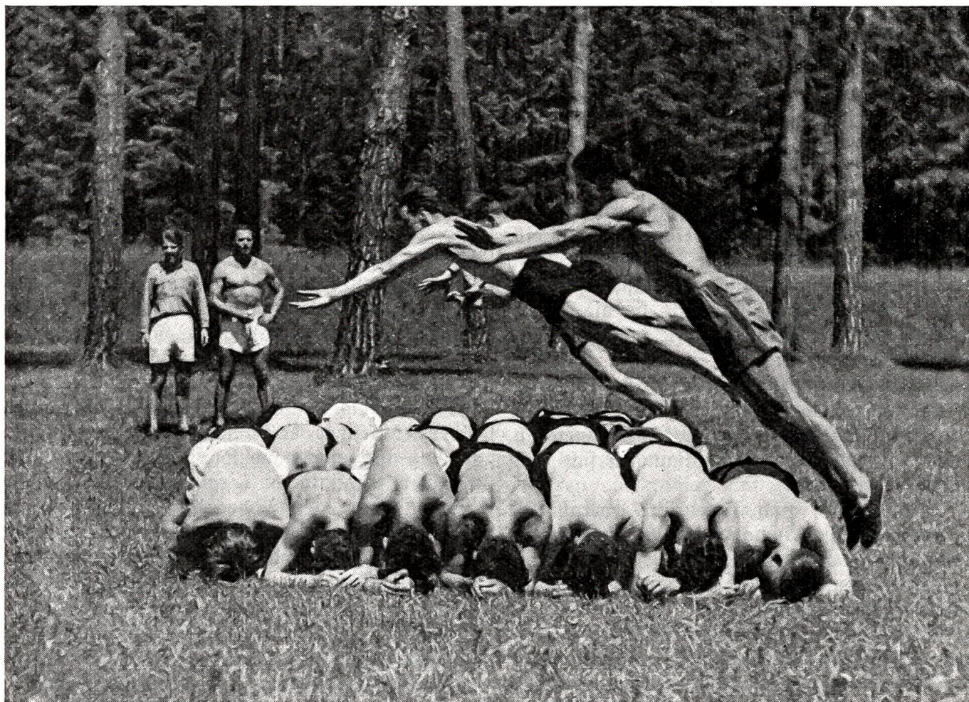
Schulung zum Nahkampf. Hechtsprung. Z. Nr. Gr. III/2952. — Produktion Schweizer Armeefilmdienst.

„Allmächtiger — so hab' ich heute nacht auch gerufen, als ich von einem Schrecken in den andern fiel“, erwiderte Herr Färber mit Mär-