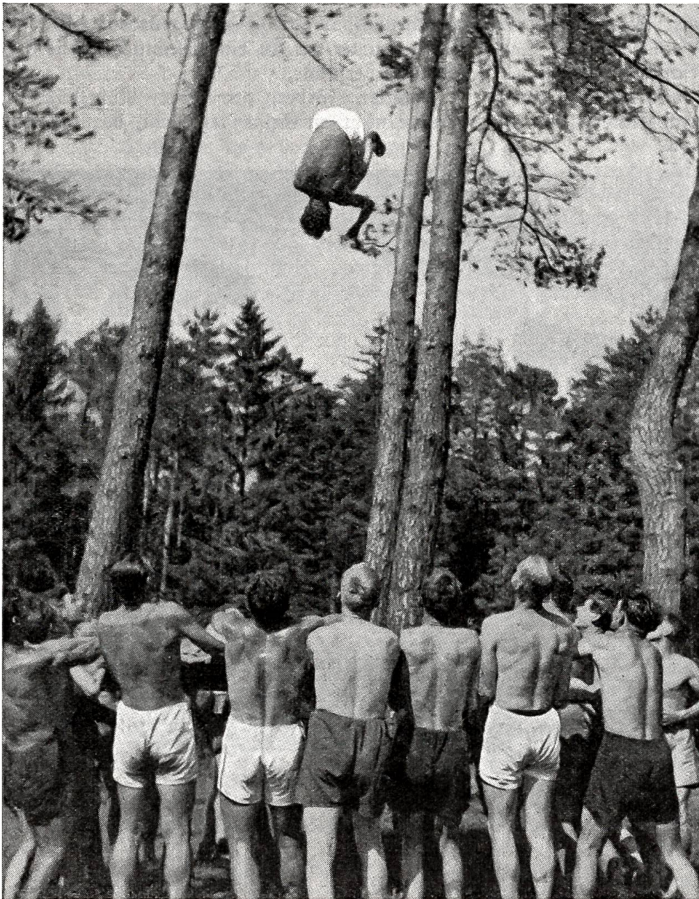
Schulung zum Nahkampf. Übungen im Sprungtuch. Z. Nr. Gr. III/2858. — Produktion Schweizer Armeefilmdienst.

hatten sich unter dieser gedanklichen Beeinflussung ein paar Tasten gesenkt und die Saiten zum Erklingen gebracht? Solche magnetische Wirkungen sollten ja möglich sein. Indische Fakire vollbringen viel größere Wunder — nur, daß seine Gattin kein indischer Fakir war. Doch hatte er gehört, daß manchmal auch ganz gewöhnliche bürgerliche Menschen zu Trägern von Wundern werden können.