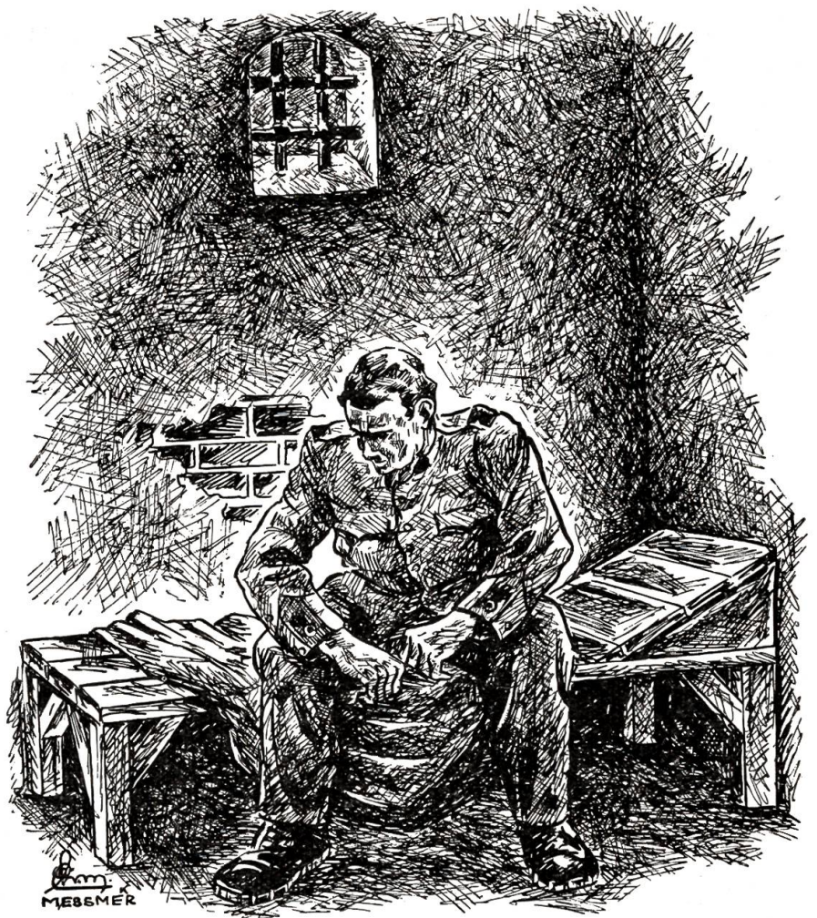
Das Herz klopfte, der Hals würgte, der Kopf schmerzte.

Mit der Milch stimmte allerdings auch nicht alles. Daß er sie zu Hause gebuttert und die Butter den Gästen verkauft hatte, war jetzt auch ausgekommen, und die schwarzen Schweine im