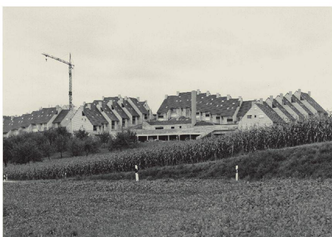
Gemeinde: Dinhart Objekt: Wohnsiedlung Datum: September 1974