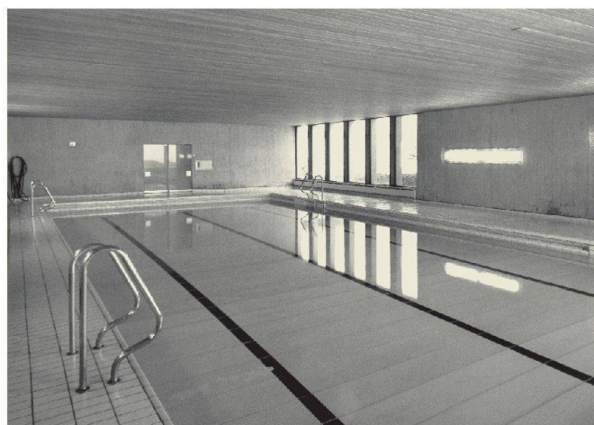
Gemeinde: Hirzel Objekt: Lernschwimmbad Datum: Januar 1970