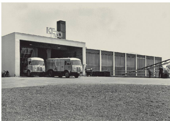
Gemeinde: Hinwil Objekt: Kehrichtverbrennungsanlage Datum: Mai 1964