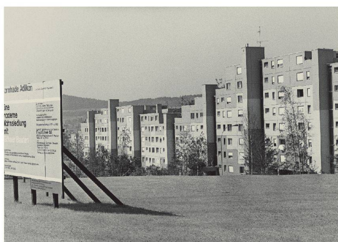
Gemeinde: Regensdorf Objekt: Wohnsiedlung Datum: Juni 1972