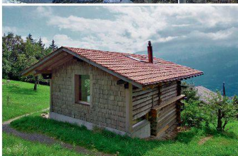
Cet été et cet automne, la Casa Döbeli à Russo TI fera l'objet d'une rénovation douce