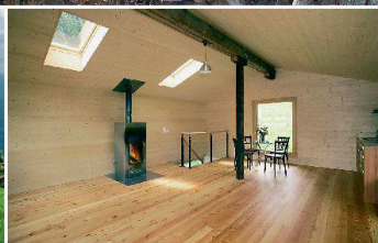
Die kleine umgenutzte Scheune in Beatenberg BE ist ab sofort zu mieten