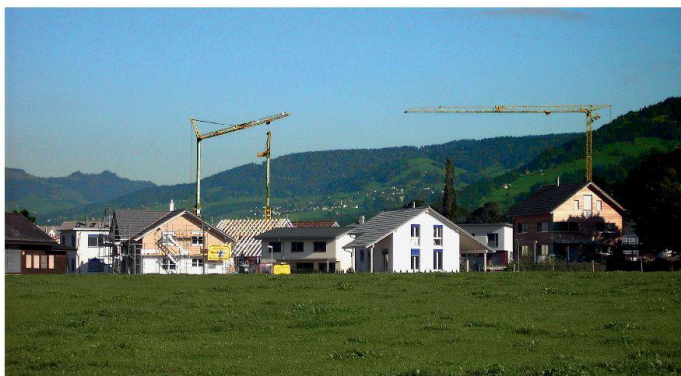
Das gültige Raumplanungsgesetz konnte die masslose Zersiedlung der Schweiz nicht verhindern

L'introduction d'une taxe pour le privilège de construire hors de la zone à bâtir mérite un soutien catégorique, mais il faut que les recettes en émanant soient expressément affectées à la protection du paysage. Patrimoine suisse estime aussi insuffisante la proposition consistant à laisser aux cantons le soin de résoudre le problème de la construction de résidences secondaires. Aussi Patrimoine suisse exige-t-il que la construction de résidences secondaires soit efficacement limitée au niveau fédéral.