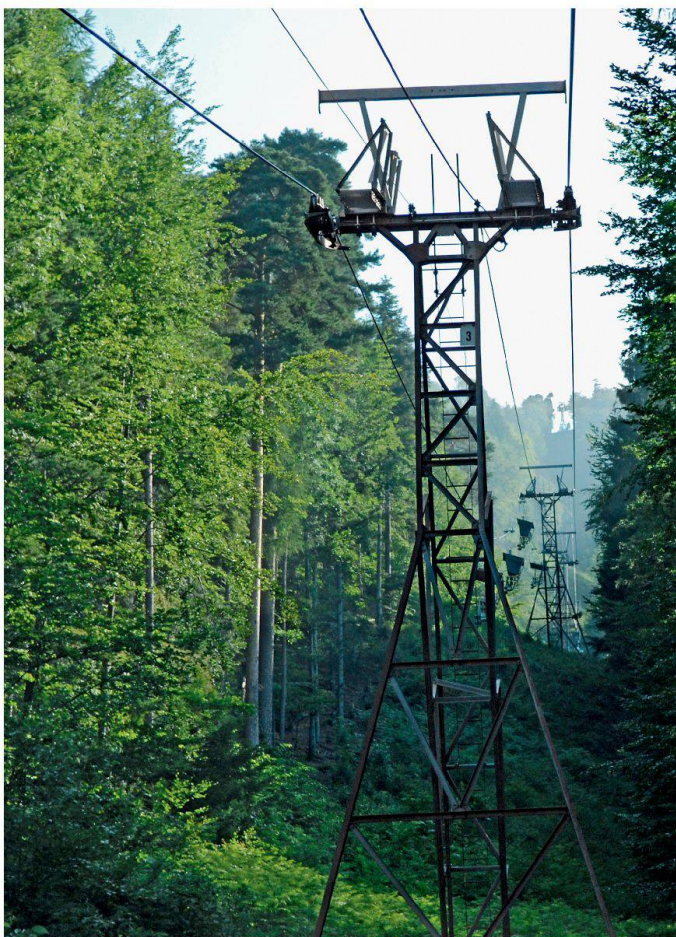
Le télésiège de 1950 représente un monument historique d'importance nationale

Les plans de la Seilbahn Weissenstein SA prennent une autre direction. Le 9 avril, la société a envoyé à l'Office fédéral des transports une demande de permis de démolir. Ceci dans le but de pouvoir commencer la construction d'une télécabine.