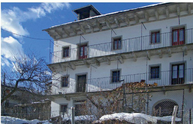
Die Casa Döbeli in Russo TI wird diesen Sommer/Herbst sanft renoviert (Bild SHS)