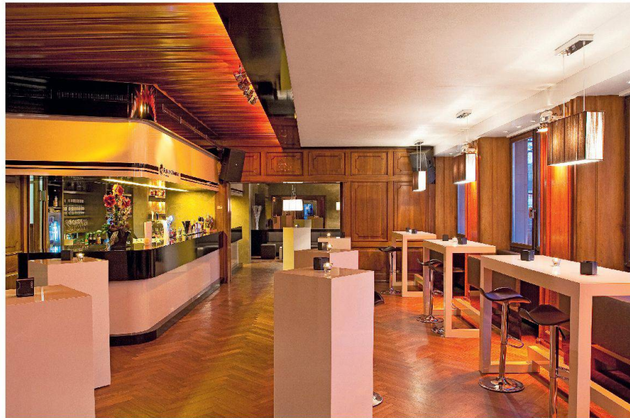
Weiss polierte Möbel in der ehemaligen Chässtube