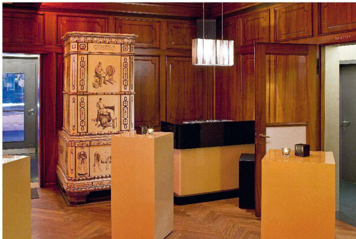
DJ-Pult neben elektrischem Kachelofen: Die Barbetreiber erhalten freiwillig möglichst viel vom Interieur.