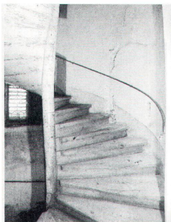
Eine konstruktiv interessante Wendeltreppe aus dem 17. Jahrhundert führt vom Erdgeschoss bis unter das Dach.

in der Form einer Stiftung gefunden, die für die Finanzierung und den künftigen Betrieb des Herrenhauses verantwortlich zeichnen wird. Das Umnutzungskonzept für die zurzeit laufenden Renovationsarbeiten sieht vor, das Haus auch in Zukunft für Ferienzwecke des Klosters Engelberg zu reservieren. Neu soll es aber auch der Öffentlichkeit für Seminare, Tagungen und andere Veranstaltungen zur Verfügung stehen. Dabei denkt man vor allem an ein Begegnungs- und Dokumentationszentrum für Menschen, die sich im Rahmen von Tagungen und Kursen mit den verschiedensten Aspekten und Problemen des Lebensraumes «Gebirge» auseinandersetzen wollen. Zu diesem Zweck sollen sie im Herrenhaus nicht nur die nötige räumliche und technische Infrastruktur vorfinden, sondern auch auf eine wissenschaftliche Dokumentation zurückgreifen können, die Fachleuten und interessierten Laien gerecht wird und ihrer Aus- und Weiterbildung dient. Das Renovationsbudget rechnet mit Gesamtkosten von rund 4,5 Mio. Franken. Davon sind bis heute 3 Mio. Franken gedeckt.