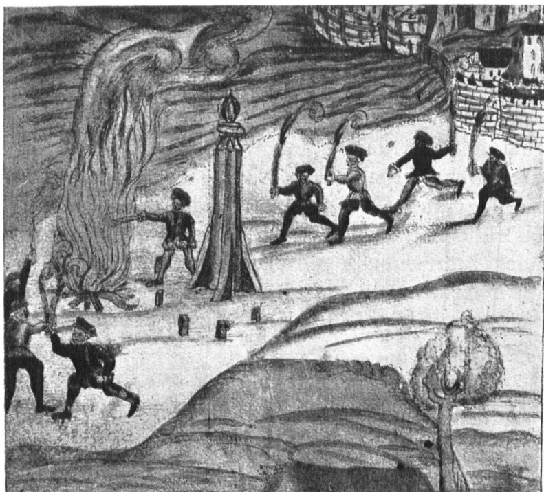
Abb. 1. Märzenfeuer bei der „Klausstud“ 1543. Aus „Wickiana“, Msk. Zentralbibliothek Zürich. Aufnahme der Zentralbibliothek. — Fig. 1. Feu de mars à la „Klausstud“ 1543. Extrait de la „Wickiana“, manuscrit de la Bibliothèque centrale de Zurich.

Gerade in den letzten Jahren, nach dem Weltkriege, der so vielen Bräuchen ein Ende bereitete, macht sich eine erfreuliche Wiederbelebung der alten Volkssitten geltend, und wo solche neuerdings auf den Plan treten, bringt man ihnen allseitig warme Sympathie entgegen. Meist braucht es nur eines kräftigen Vorstosses, um dem alten Brauch wieder zu seinem Rechte zu verhelfen. So kommt es, dass auch im Kanton