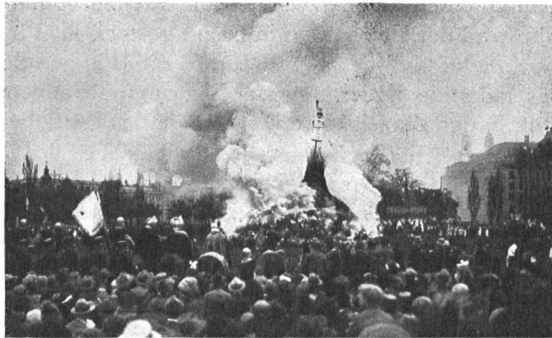
Abb. 5. Sechseläuten in Zürich (1923). Verbrennen des Bögg. — Fig. 5. Le feu de «Sechseläuten» à Zurich (1923). On brûle le «Bögg» (mannequin symbolisant l'hiver).

Ein Frühlingsfest ist auch die wichtigste festliche Veranstaltung in der Stadt Zürich, das Sechseläuten .