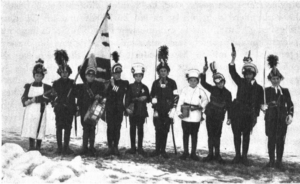
Abb. 2. Umzug in Fischenthal (1925). — Fig. 2. Cortège à Fischenthal (1925).

Mit der Fastnacht ist seit alter Zeit auch die Vermummung, die Maske , eng verbunden. Früher sah die Verkleidung ganz einfach aus und es erfolgte die Verhüllung des Gesichtes durch Färben oder auch durch phantastisch gefärbte Holzmasken, wie sie z. B. die Lachner trugen, die am Zürichsee häufige, aber auch gefürchtete Gestalten waren und noch heute an der Fastnacht und beim Klausspiel vorkommen. Als Waffe dienen etwa eine Schweinsblase oder eine Bürste, mit der die Vorübergehenden gehörig gekratzt werden. Der Vermummung kommt eine bestimmte Bedeutung zu: Mit den Masken glaubten die Heiden die vegetations- und menschenfeindlichen Dämonen verjagen zu können; diesem Glauben lag die Ansicht zu Grunde, dass der Dämon vor seinem eigenen Gesicht flieht, das er in der Maske findet. Eine althergebrachte Gewohnheit der „Böögggen“ ist das Betteln, das heute freilich nicht mehr so schwunghaft betrieben wird wie ehemals. Eine weitverbreitete Fastnachtsitte ist das Chüechlen, das auch in weitentlegene Zeiten zurückreicht.