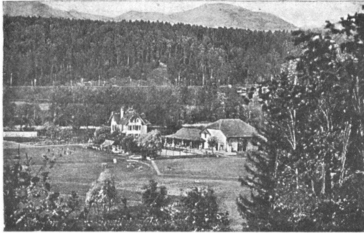
Inter Silvas Erziehungsheim für Knaben. — Villa Erika und Inter Silvas Wangen a. A. (Schweiz). Ideale Lage inmitten ausgedehnter Waldungen, 10 Min. v. Bahnhof u. Städtchen. Grosse Liegenschaft mit eigenem landw. Betrieb. Moderne Einrichtungen. Ration. Gesundheitspflege. Individuell. Unterricht. Familienleben. Beste Refer. Direktion: F. G. Schmutz-Pernaux, diplom. an den Universitäten Bern, Neuenburg und London.