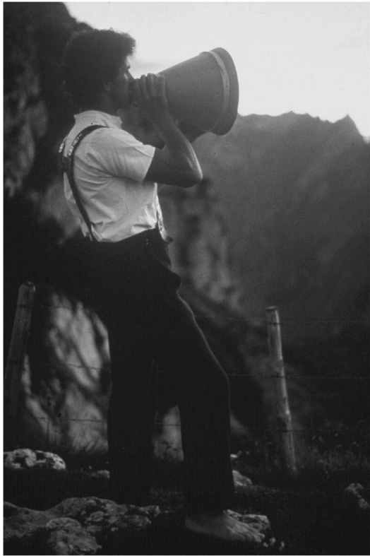
Abb. 1: Alpsegenrufer in Innerrhoden. 1990.

Der Milchtrichter wird in der Innerschweiz Volle genannt. Dieser Begriff lässt sich aus dem Volleschübel erklären, dem Kolbenbärlapp, dessen Wurzel früher in den Trichter gestopft wurde, um die größten Unreinlichkeiten in der Milch beim Umgießen vom Melkeimer in die Milchkanne aufzufangen.