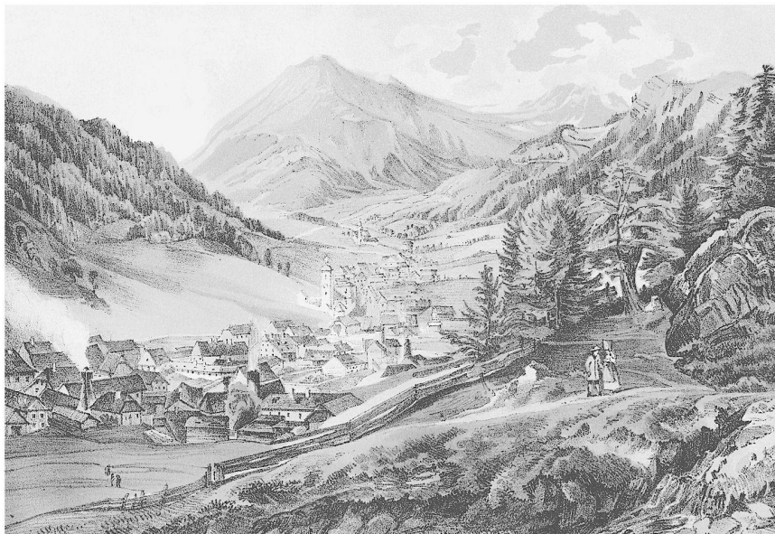
L'industria mineraria del Vordernberg, Stiria.

una produzione annua di circa 2200 tonnellate e con il laminatoio costruito nel 1792 a Lippitzbach, quelle della famiglia Egger a Triebach erano imprese di primo piano, grazie in particolare al loro elevato standard tecnologico.