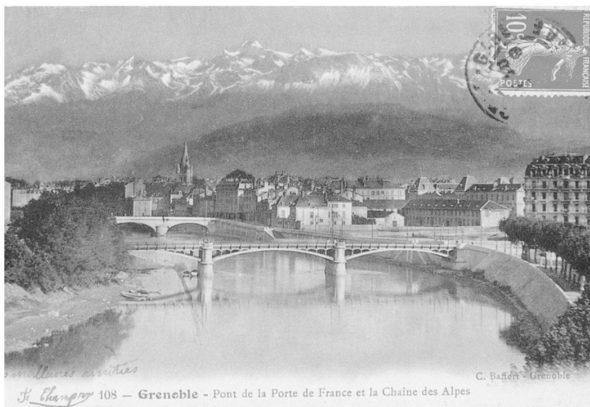
Fig. 3: Vue de Grenoble vers 1900. Carte postale.

chaque extrémité de rue, une cime scintille au-dessus des toits, l'un des quartiers de la ville est construit sur le dernier renflement des montagnes de la Chartreuse, mais c'est surtout des quais de l'Isère que se développe aux yeux le magnifique éventail des crêtes de la chaîne des alpes dauphinoises et des escarpements du Vercors. L'espace de six à huit kilomètres qui sépare la ville de cette pittoresque enceinte lui ménage abondamment l'air et la lumière, mais les monts sont assez grands, assez abrupts, assez hauts sur l'horizon pour que l'œil en scrute tous les replis, en caresse tous les détails. Ils s'imposent à la vue comme une réclame sans cesse renouvelée, on s'y intéresse en quelque sorte malgré soi et on y va. Ainsi notre ville de Grenoble a-t-elle depuis longtemps mérité le surnom de Reine de l'Alpinisme.» 16