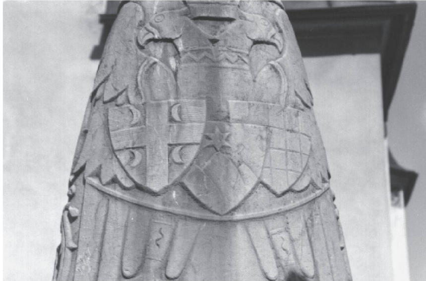
Triglav als slowenisches Symbol auf dem Mantel der Muttergottes vor der Pfarrkirche in Bled, ausgearbeitet vom Architekten Jože Plečnik, 1934.