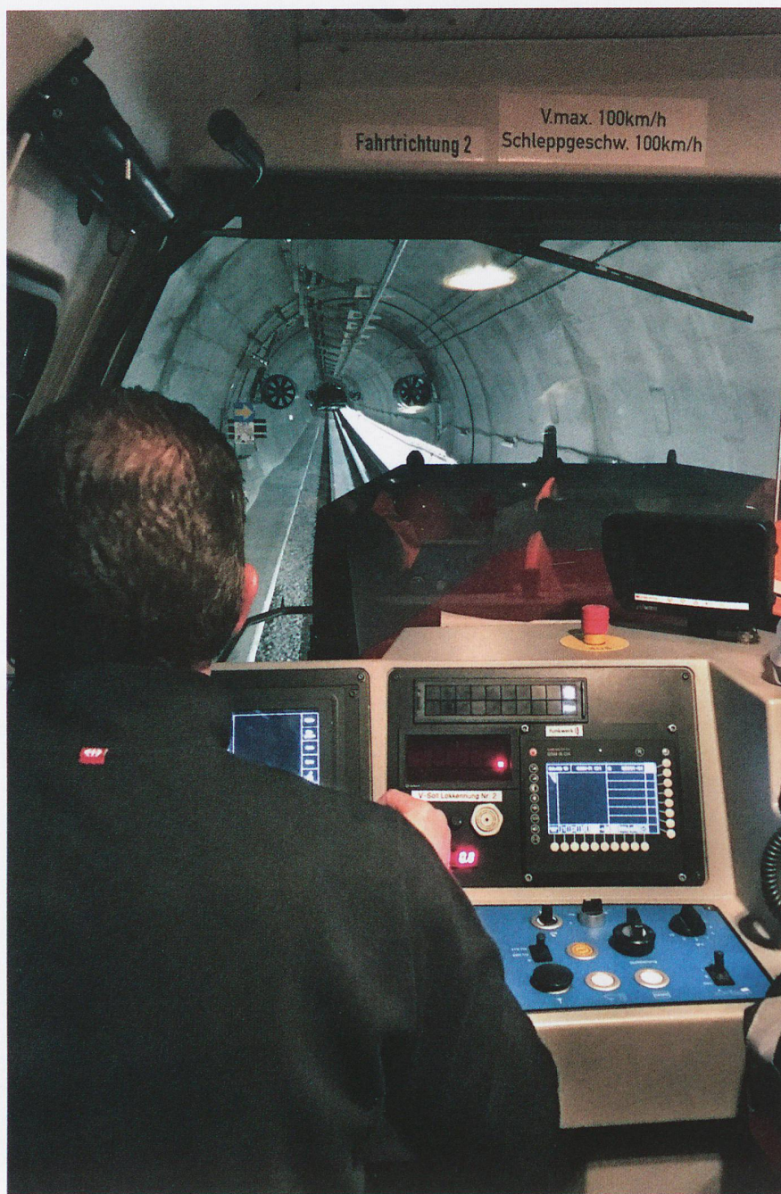
Manca poco all'inizio delle corse di prova alla Galleria di base del Ceneri.

Dal mese di settembre del 2019 è in corso la verifica end-to-end in loco, (2a prova parziale), che consiste nel verificare il buon funzionamento di interruttori, pompe, saracinesche, ventilatori, sensori vari ecc. e nel correggere eventuali anomalie e collegamenti sbagliati. Sono stati testati la ventilazione d'esercizio e dei cunicoli trasversali, le porte dei cunicoli trasversali, i sistemi di smaltimento delle acque, l'impiantistica installata negli edifici della tecnica ferroviaria e i sistemi di comunicazione. Terminata la 2a prova parziale, a febbraio 2020 il sistema sarà pronto per il test di integrazione globale, in cui funzioni e processi operativi saranno controllati minuziosamente.