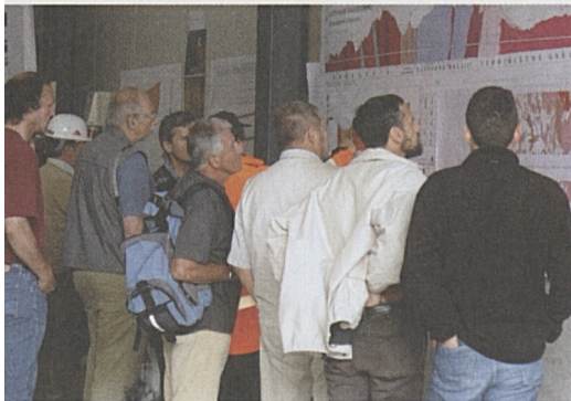
Mit dem Los für die Schachtfahrt gings los.