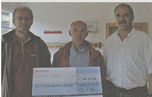
Spendenübergabe in Sedrun.