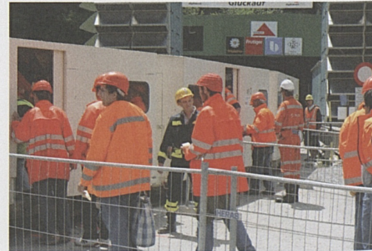
VIP-Gruppe verlässt den Lift am Schachtkopf.