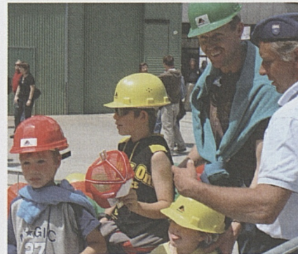
Eine Besuchergruppe am Schachtfuss.