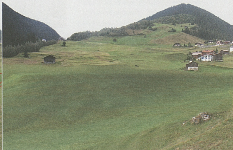
Nach dem Abschluss der Arbeiten wird die neue Deponie rekultiviert (Fotomontage).