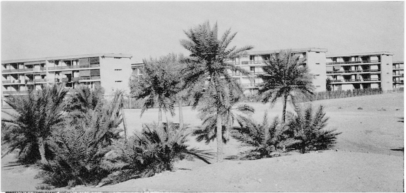
Abb. 2 Ouargla. Teilansicht des Quartiers Selis mit den neuen viergeschossigen Wohnhäusern

angeordnet, daß die im Winter schräg auffallenden Sonnenstrahlen die anschließenden Hausräume zu erreichen und erwärmen vermögen, nicht aber im Sommer. Auch wurden vor den Südfassaden Grünflächen angelegt, die die Aufgabe haben, einen Teil des aufprallenden Sonnenlichts zu absorbieren. Solch moderne, zur überlieferten Bauweise im Widerspruch stehende Bauten erheben sich auch bereits in andern Oasen, wie Touggourt, Béchar 3 , Biskra. Steht man vor ihnen, hat man sich einer leichten Melancholie zu erwehren und ebenso, wenn man ihre Wohnungen betritt. Anstelle orts-eigener handwerklicher Erzeugnisse fast lauter europäische Fabrikware. Dies auch schon in den Wohnungen vieler Einheimischer. Statt zum Beispiel Geschirr aus Ton oder Lehm sieht man nun solches aus Aluminium, Email und Plastikstoffen. Auch wird — sogar unter den Zelten — nicht mehr auf Holz- oder Kohlenfeuer gekocht, sondern auf Gasherden; das Butangas kommt aus Algier. Das Radio ist fast durchwegs vorhanden und gelegentlich sogar Kühlschranks für den Sommer und Gasofen als Winterheizung. All diese Gegenstände kann man an Ort und Stelle kaufen.